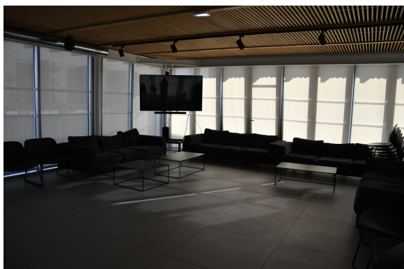
Salle de convivialité (Récup, aide aux devoirs, vidéo)