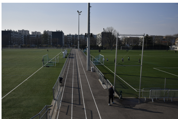
Stade Jacques Joly