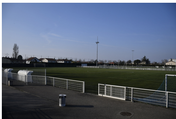
Stade Jean Bouin